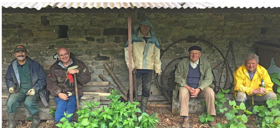
La pluie met l'équipe «renouée du japon» au chômage technique