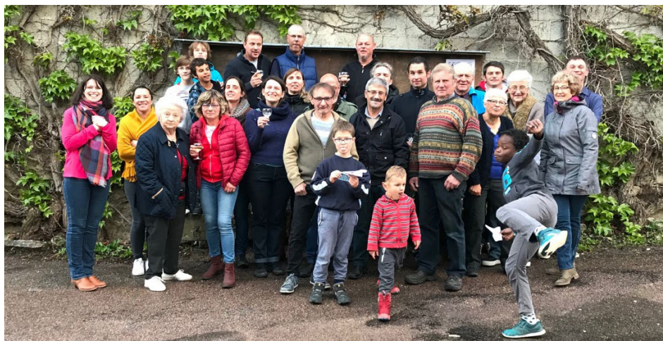
Une partie de l'équipe juste avant le repas