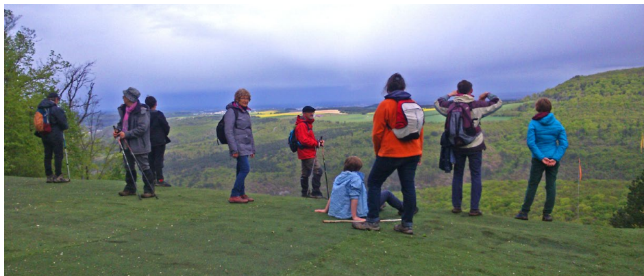
Point de vue sur l'aire de parapente à Notre-Dame d'Étang