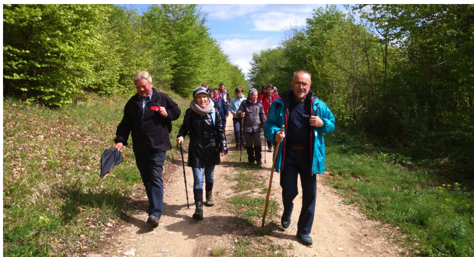
Soleil et parapluie