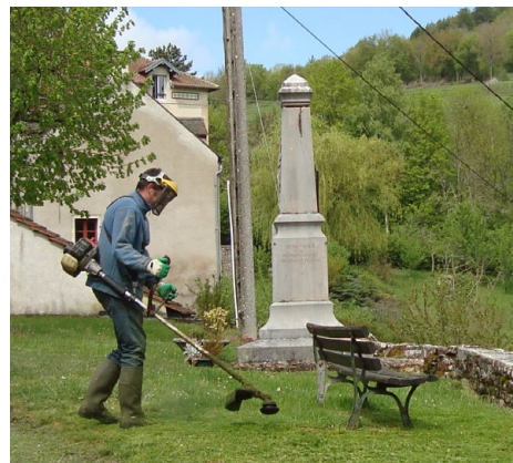
Un débroussaillieur autour de l'église